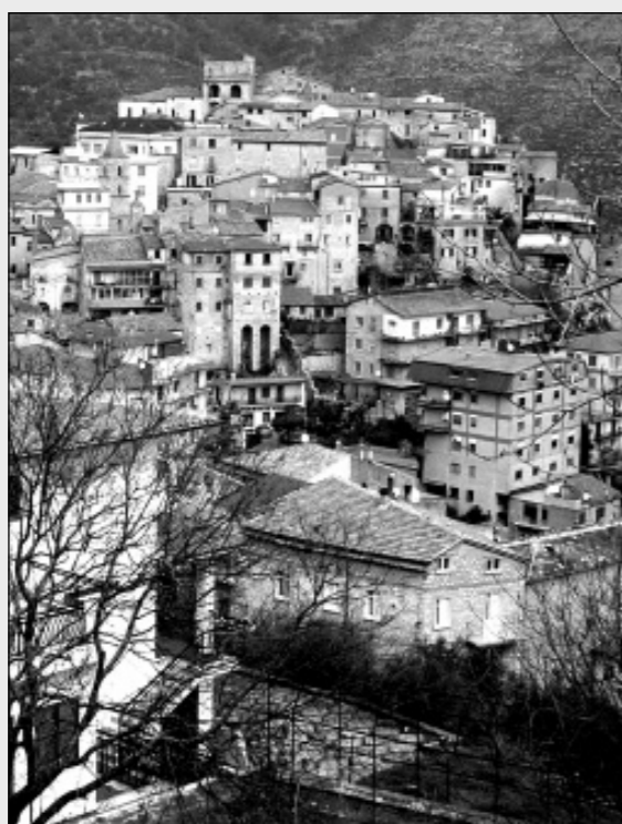
Una immagine di Lenola. In alto Sermoneta